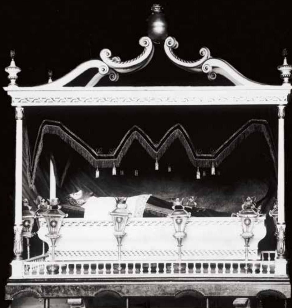
PASO DEL SANTO SEPULCRO DEL AÑO 1619